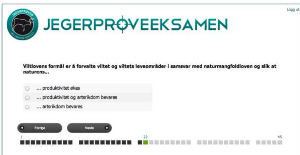
Figur 3. Fullfør teksten for riktig svar.